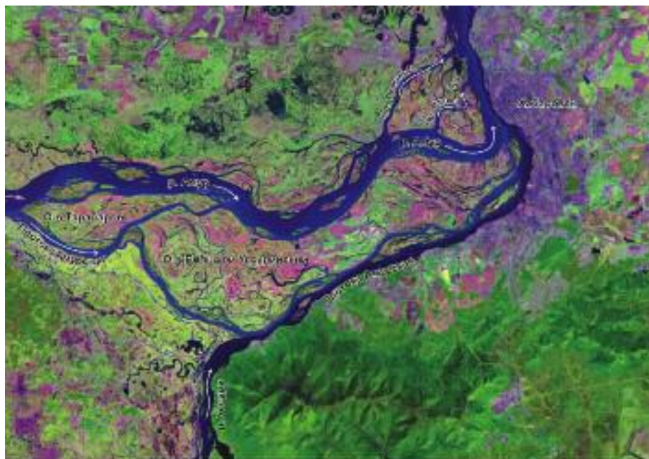
Река Амур у г. Хабаровска